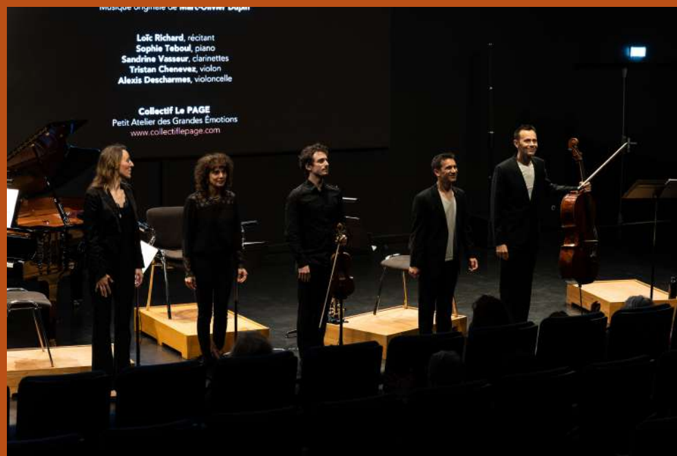
Musique originale de Les Choristes - Angès